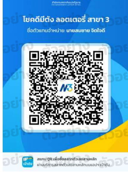
ตัวอย่าง QR ร้านสลากฯ