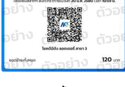
ตัวอย่าง QR ซื้อ-ขายสลากฯ