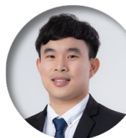
นักวิเคราะห์