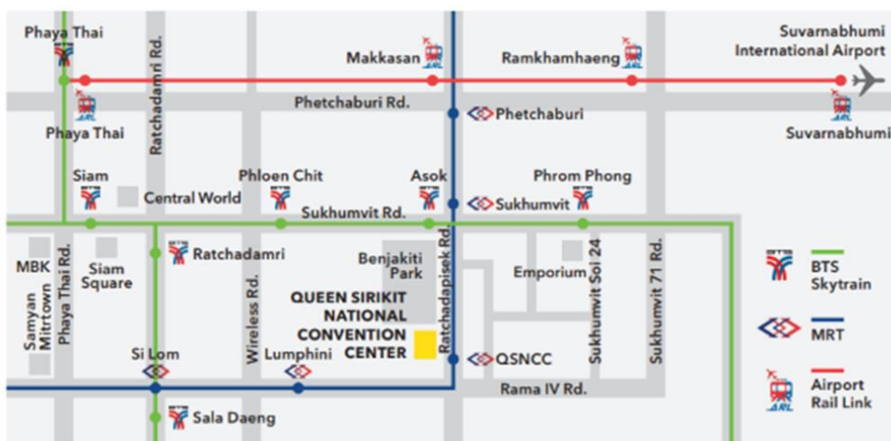
แผนที่ศูนย์ประชุมแห่งชาติสิริกิติ์

สถานที่จอดรถ หากจำเป็นต้องนำรถส่วนตัวมา สามารถจอดได้ที่ลานจอดรถของศูนย์ประชุมแห่งชาติสิริกิติ์ตามที่จัดเตรียมไว้ให้ โดยไม่มีค่าใช้จ่าย