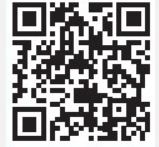
SCAN ตัวอย่างการคำนวณกรณี MRR ปรับเพิ่มสูงขึ้น

หากข้อมูลในการติดต่อของลูกค้ามีการเปลี่ยนแปลง กรุณาแจ้งให้ธนาคารทราบ ผ่านสาขาที่ลูกค้าใช้บริการ